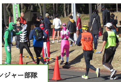
今年も活躍したレンジャー部隊